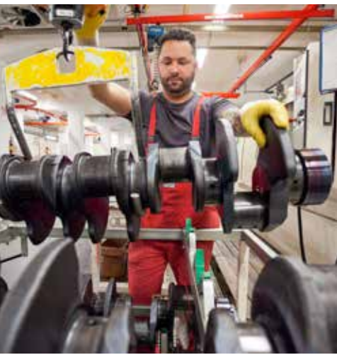
Mitarbeiter von Feuer Powertrain