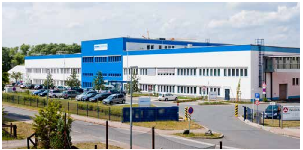
Firmengebäude von ThimmSchertler