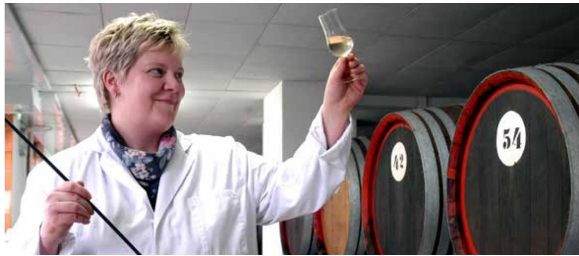
Produktionstätte Nordbrand Nordhausen