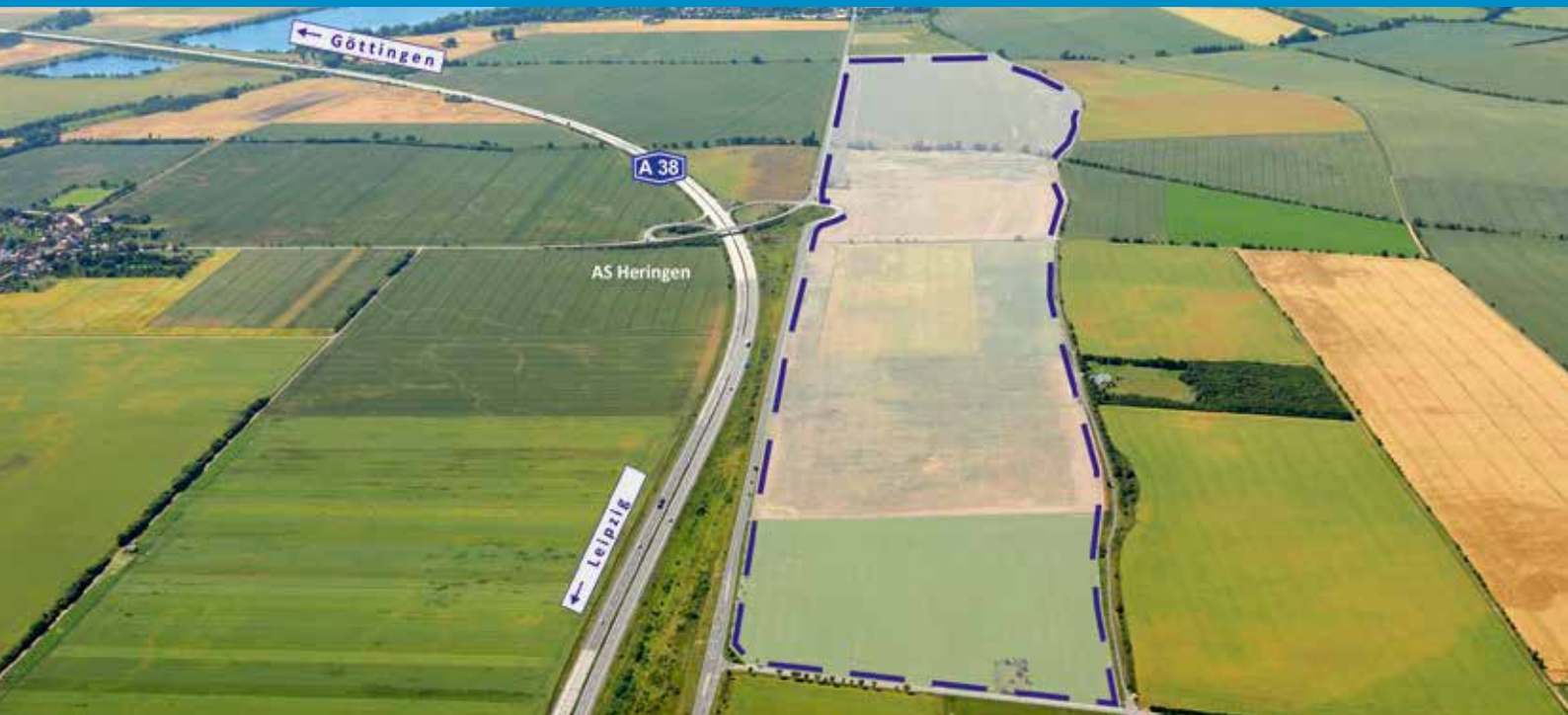
Luftbild Industriegebiet „Goldene Aue“ in Nordhausen