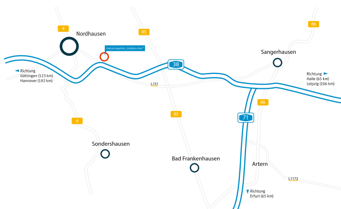
Verkehrsanbindung des Industriegebietes „Goldene Aue“

Nordhausen verfügt über einen Sonderlandeplatz für Geschäftsverkehre bis 5,7 t.