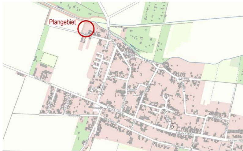
Darstellung ohne Maßstab